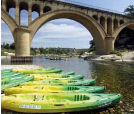
Canoë sur le Gardons